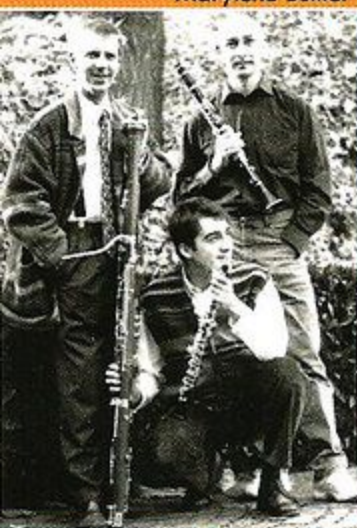
Le Trio de Poche