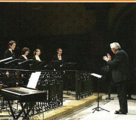
Les Belles Chanteuses